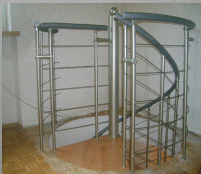
Balustrada ochronna do otworu okrągłego